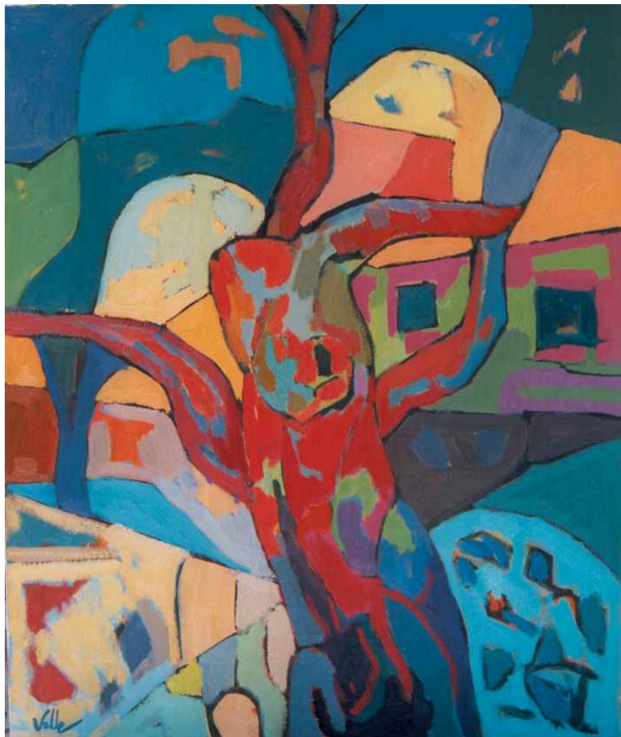
Olivera. Oli s/t 65x54 cm.