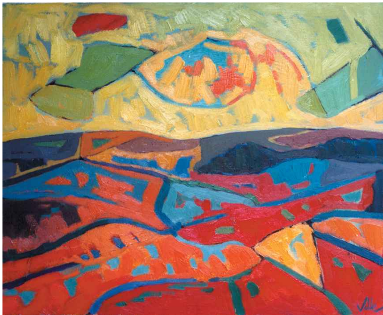
Migdia. Oli s/t 50x61 cm.